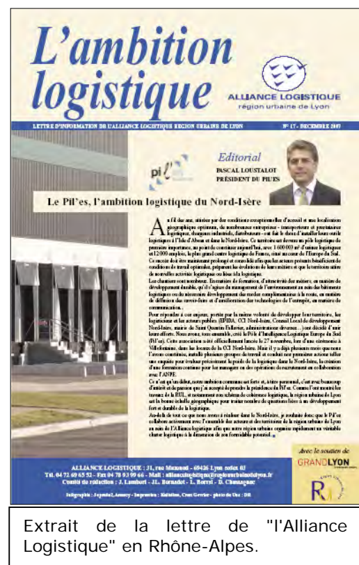
Extrait de la lettre de "L'Alliance Logistique" en Rhône-Alpes.