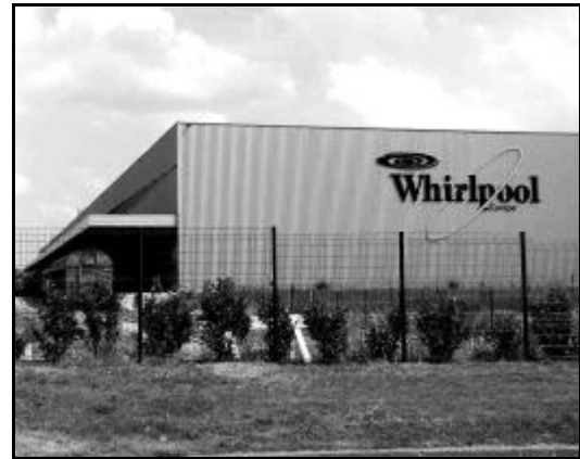
Whirlpool - Z.I. Amiens Nord (80)

L'existence d'un tissu, d'une expérience et d'une culture industriels favorables aux implantations logistiques de caractère industriel, la grande proximité de concentrations économiques et urbaines de niveau européen (Ile-de-France, Nord Pas-de-Calais), l'excellente accessibilité de la région sur un axe de transit européen majeur et la proximité de Roissy constituent les principaux atouts de la région Picardie. Par contre, la faible présence des industries à haute valeur ajoutée et de haute technologie, la relative modestie des pôles urbains et l'absence de connexions fonctionnelles avec le système portuaire européen sont des handicaps pour la région Picardie.