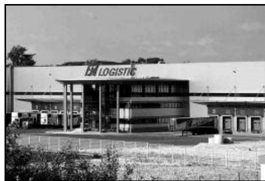
Faure et Machet - Longueil Sainte Marie (60)

Elles sont au nombre de deux en Picardie. L'espace industriel Nord d'Amiens (près de 500 ha) comprend un certain nombre de services adaptés (station de lavage de poids lourds, centre de dédouanement, surveillance-gardiennage, maintenance...). Actuellement saturée, la zone s'est vue octroyer une extension de 100 ha dont la vocation logistique est affirmée. La zone d'activités de Paris-Oise à Longueil Ste-Marie dans l'Oise (200 ha) n'est occupée que par trois prestataires logistiques mais figurant parmi les leaders nationaux (Danzas, Faure et Machet et Stockalliance). La Picardie compte aussi des zones logistiques de fait, comme la zone industrielle Nord de Compiègne, le parc d'activités sud de Nogent-Sur-Oise, le parc d'activités de Crépy-en-Valois, l'ensemble Plessis-Belleville - Lagny le Sec et également à Roye et Chaulnes.