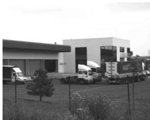
Magetrans-Prévoté - Villeneuve Saint Germain